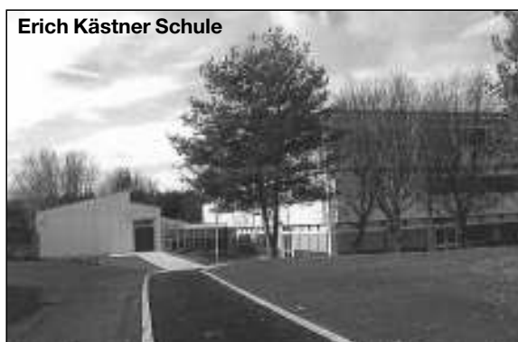
Erich Kästner Schule

Für die Erich Kästner Schule gibt die Gemeinde in diesem Jahr 670 000 Euro aus, somit je Kind 1.164 Euro für den Betrieb und Unterhalt der Gebäude sowie den Schuldendienst.