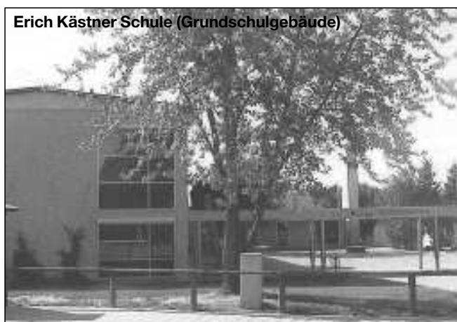
Erich Kästner Schule (Grundschulgebäude)

Zum September 2003 sind von unserer Schule folgende Kinder nach Neumarkt gewechselt: