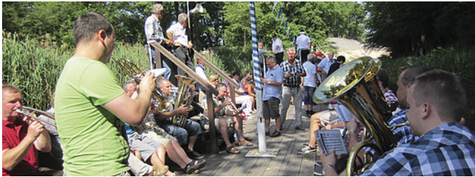
Traideln mit der „Elfriede“