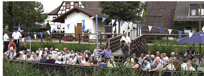
Gasthof „Zum Ludwigskanal“

Über die kleine Holzbrücke wandern wir weiter, nun links mit dem 1 am Kanal und den zahlreichen, nummerierten Apfelbäumen entlang bis zum ersten Übergang. Hier rechts nach oben, die 7 übernimmt nun wieder die Führung rechts über die Wiese den Hang hinauf. Beim Scheitelpunkt, am Peuntinger Eck, lohnt ein Blick zurück, bevor es geradewegs nach unten und am Weiher vorbei vor zur Straße geht, dort dann links hoch. In der Dorfmitte am Kreisel geradeaus in die Sackgasse und im Rechtsbogen hinaus ins offene Feld, 1 bleibt das Wegezeichen. Kurvenreich geht es hoch bis zum Waldrand, wo sich zum wiederholten Male eine herrliche Fernsicht bietet. Im Fokus: der Moritzberg (links) und der Nonnenberg .