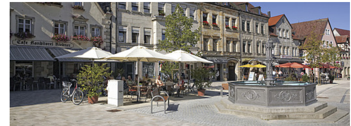
Marktplatz in Altdorf

Vorsichtig über die nach links führende Türkeistraße, geht es schräg nach rechts über Kopfsteinpflaster in der Königsbühlstraße hinauf zum Marktplatz. Links: das alte, jetzt Kultur-Rathaus; rechts: die spätbarocke Stadtkirche St. Laurentius. Ein kurzer Linksschwenk und schon stehen wir zwischen dem Oberen und Unteren Markt.